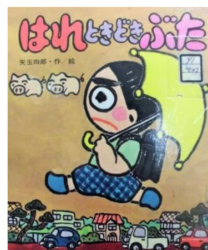
はれときどきぶた