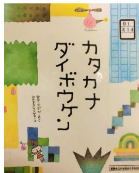
カタカナダイボウケン